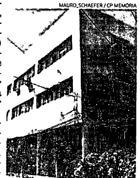
Furg desaprova volta presencial proposta

Para a Universidade Federal do Rio Grande, há impossibilidade de retomada presencial, por enquanto. A Reitoria destaca que, com 15 mil profis-