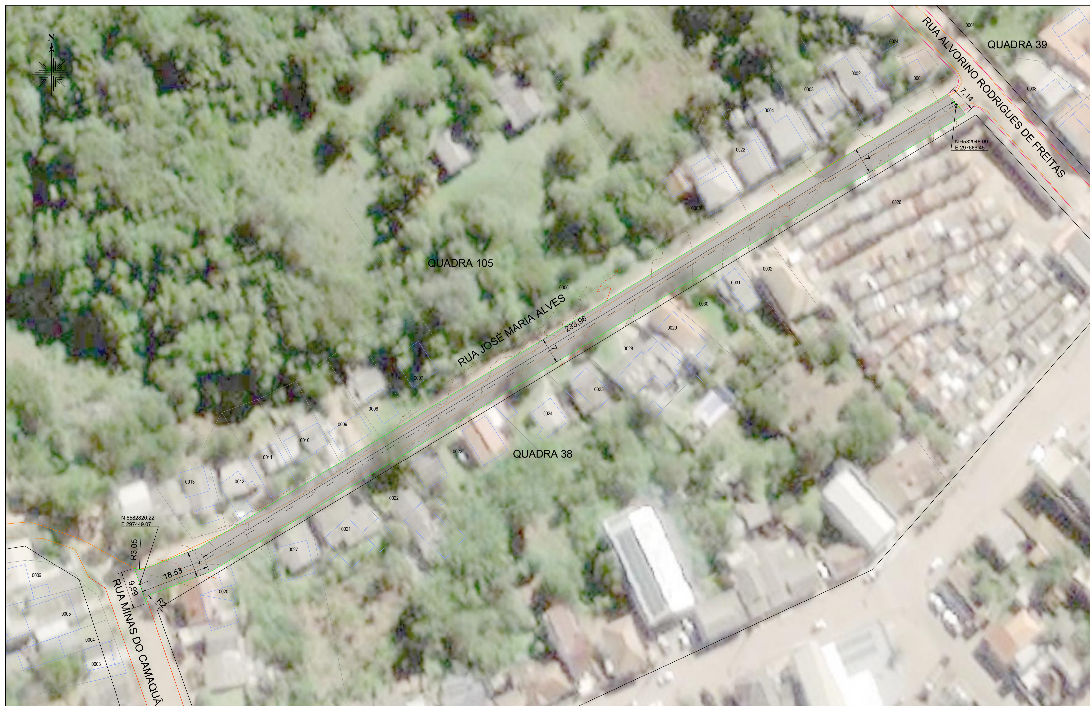
PLANTA-BAIXA ESC. 1:500